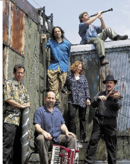
The Klezmatics

Holly Near war in der Theatersaison 1969/70 als Einundzwanzigjährige im Ensemble der Broadway-Produktion des Musicals Hair dabei, und hat danach als Friedensaktivistin mit Jane Fonda, Pete Seeger, Arlo Guthrie, Joan Baez, und anderen zusammengearbeitet: